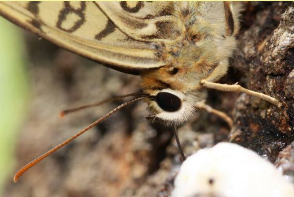
キマダラヒカゲの V字ANTとつぶらな瞳