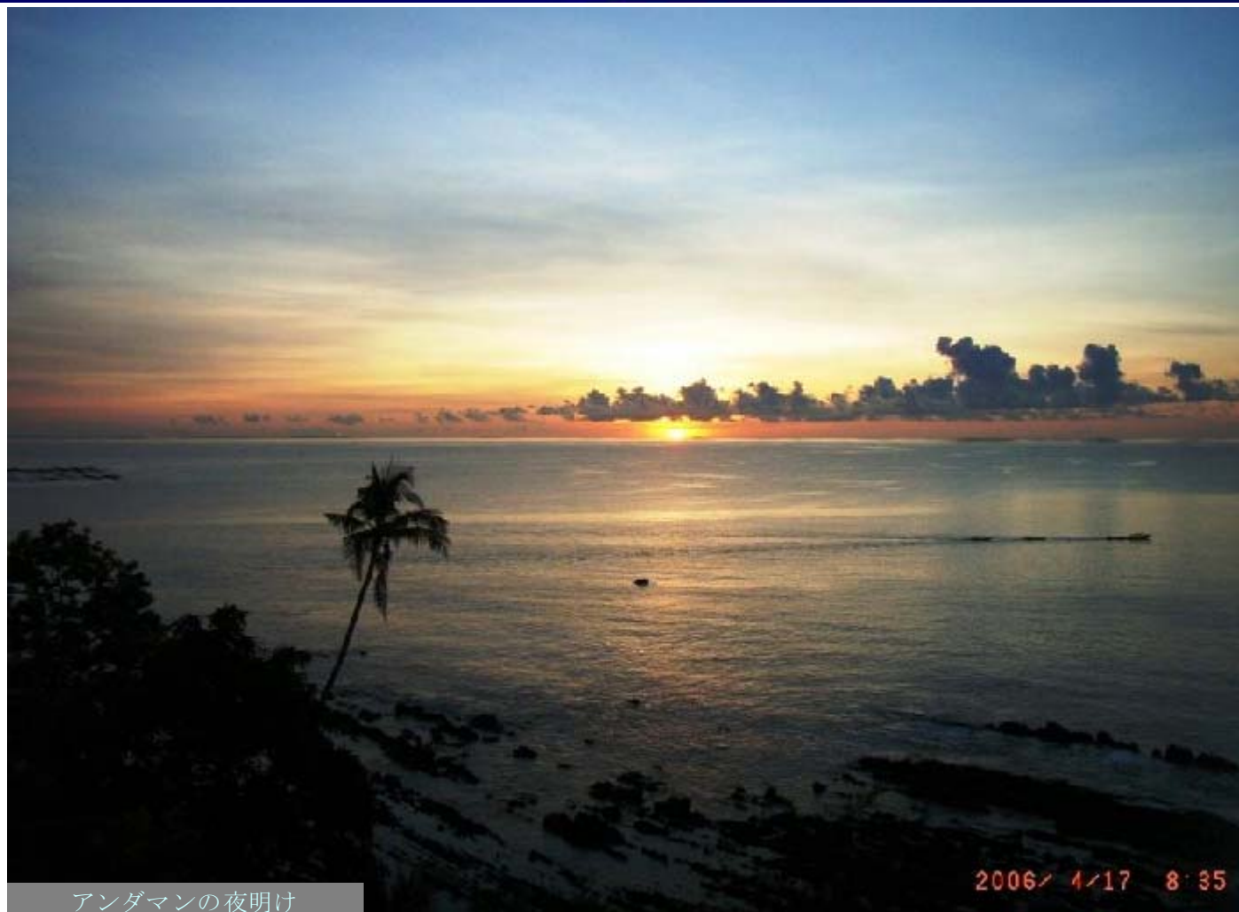
アンダマンの夜明け