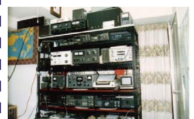
比較的シンプルな頃