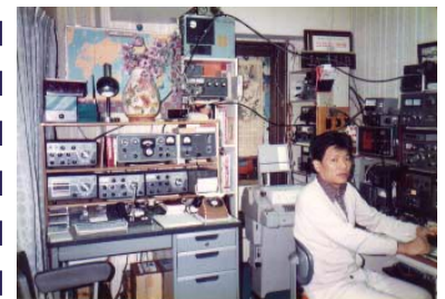
ドレークがメインの頃